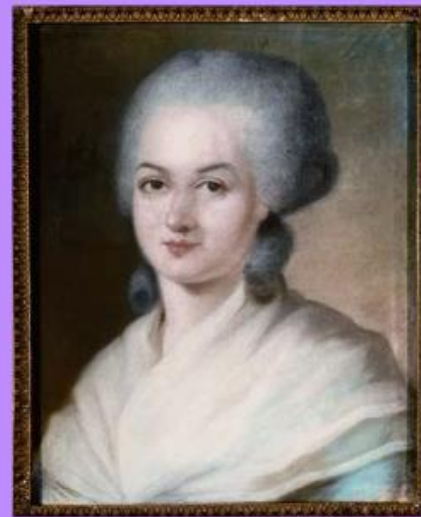
Olympe de Gouges